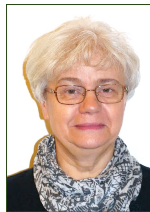
és f.: Tücsi